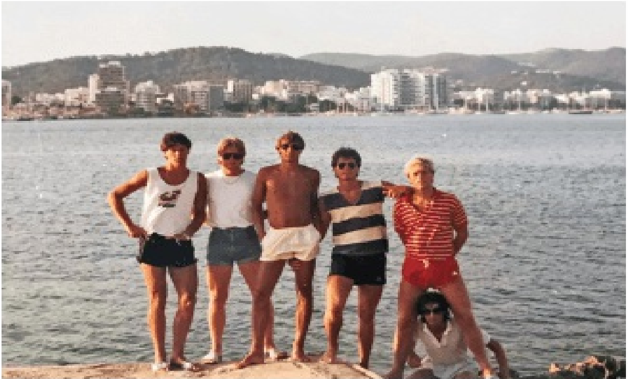
В Ибуса през лятото на 1985 г.