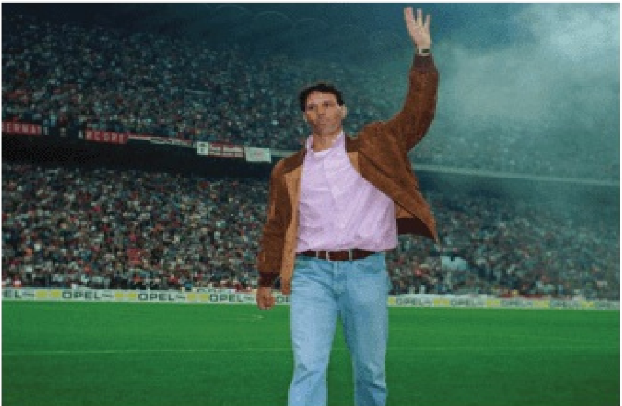
Сбогуването на Сан-Сиро, 1995 г.