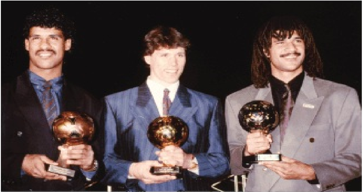
Франк Руйкард (Бронзова топка), Марко (Златна топка) и Рууд Гулит (Сребърна топка), 1989 г.