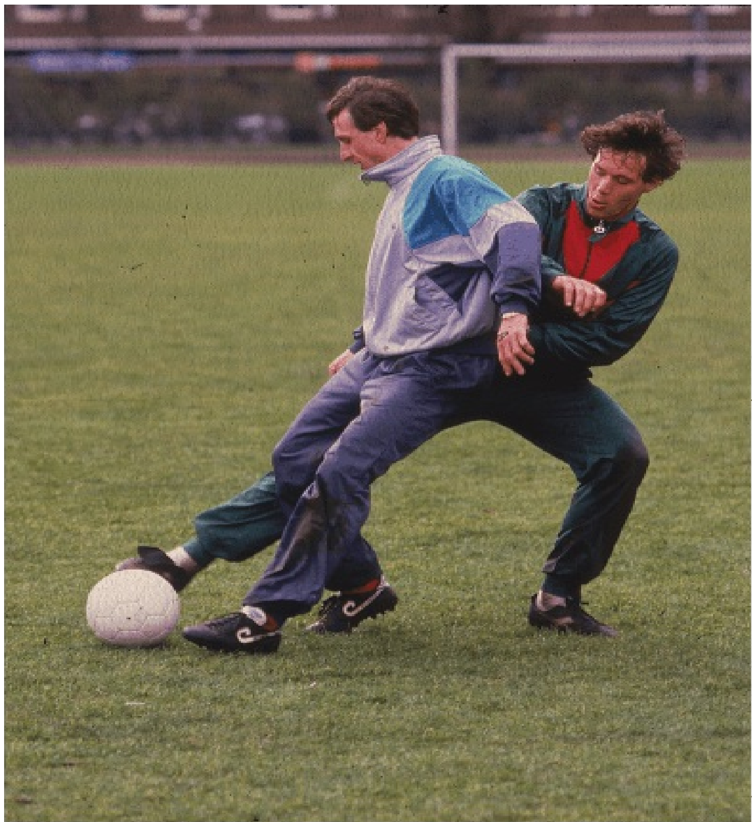
Йохан Кройф с Марко през възстановителния му период, февруари 1988 г.