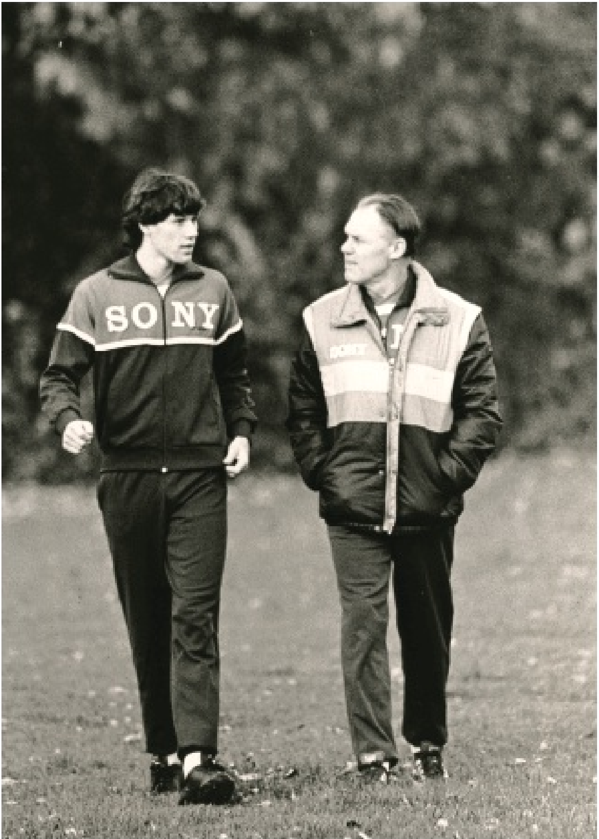
Марко с треньора на националния отбор Ринус Михелс, 1984 г.