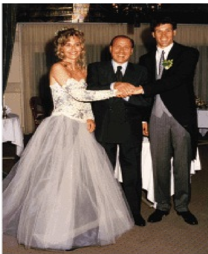
Марко, Лузбет и Силвио Берлускони