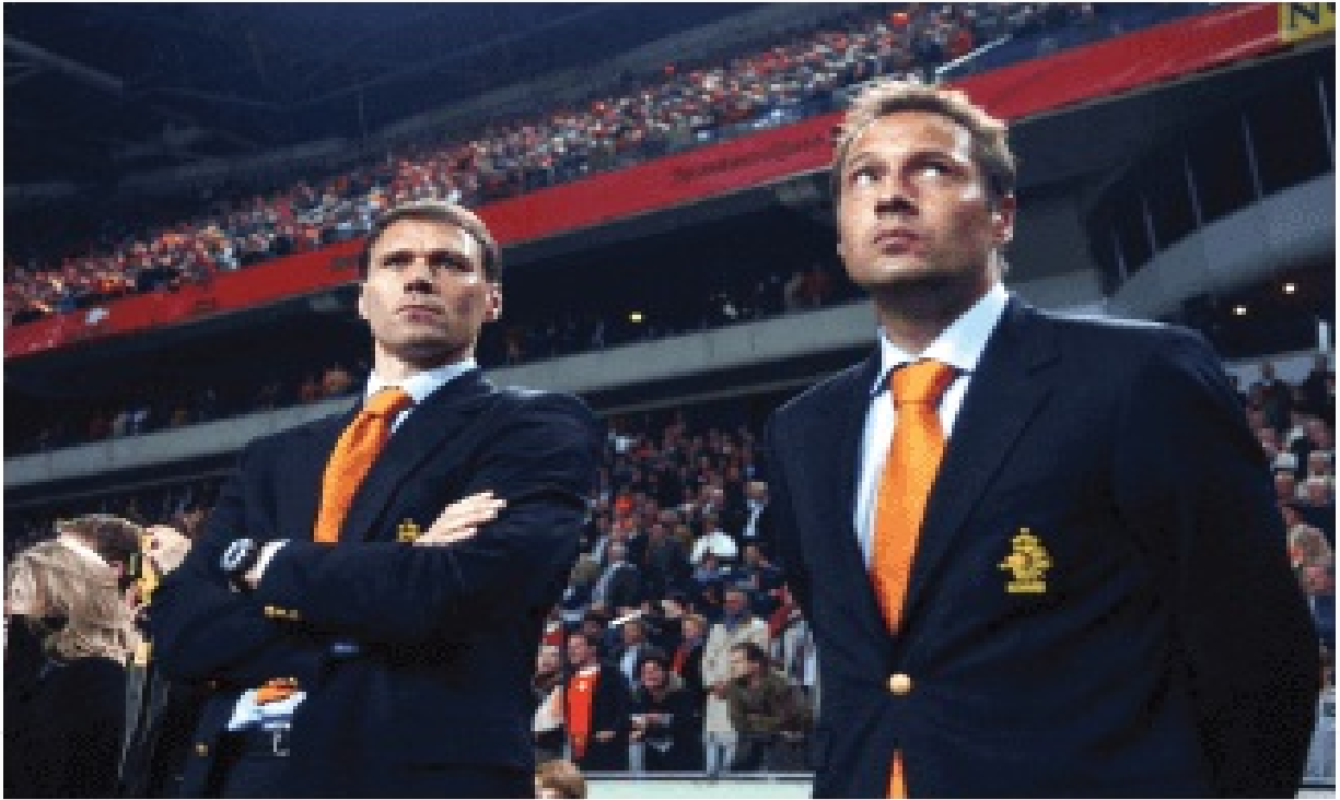
Марко като национален треньор на Нидерландия с Джон Ван т'Схип