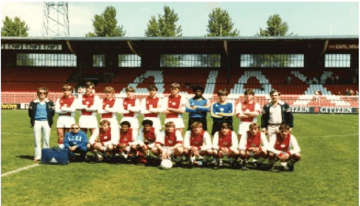
Юношеският отбор на Аякс през 1981 г.