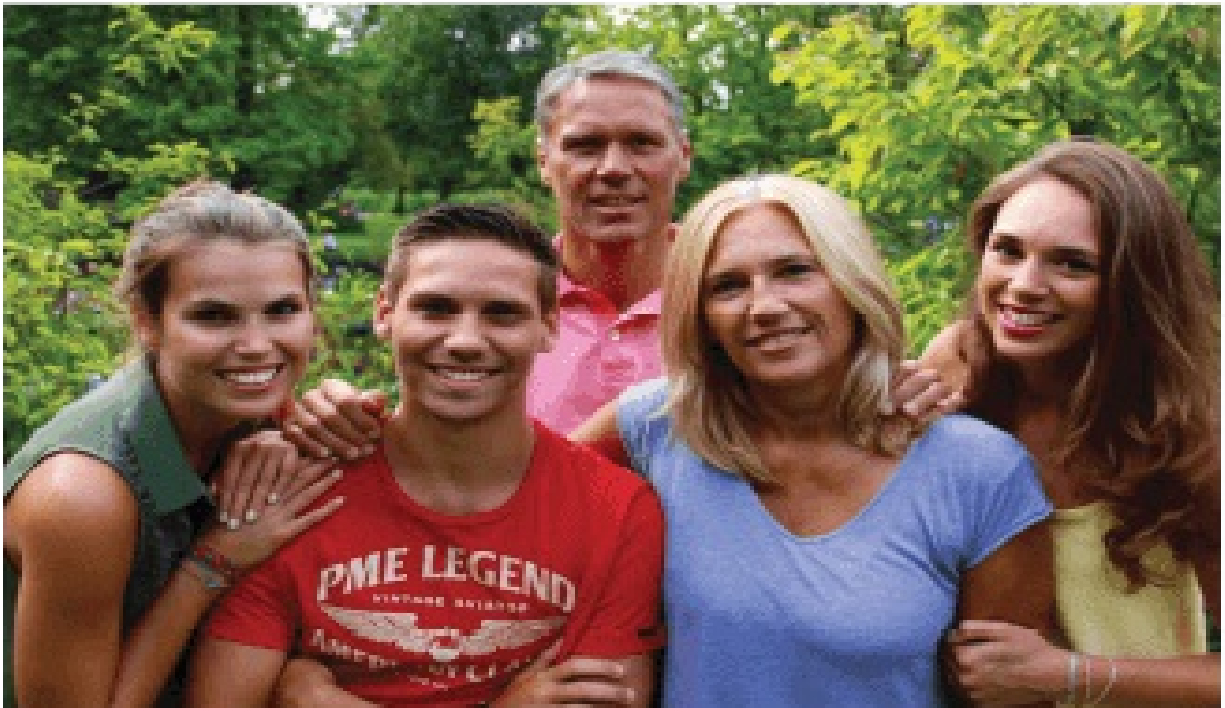
Семејна снимка од 2016 г.