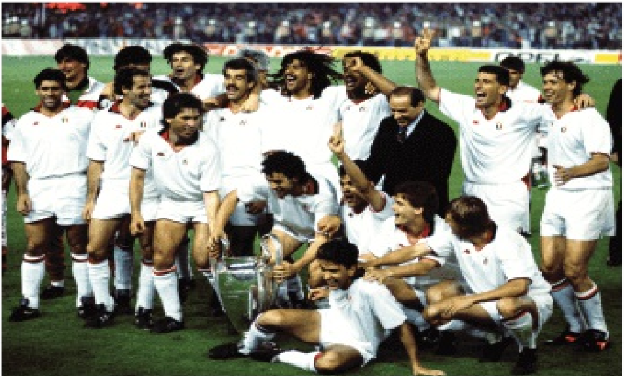
АК Милан празнува победата над Стяуа Букурещ във финала на КЕШ на 24 май 1989 г.