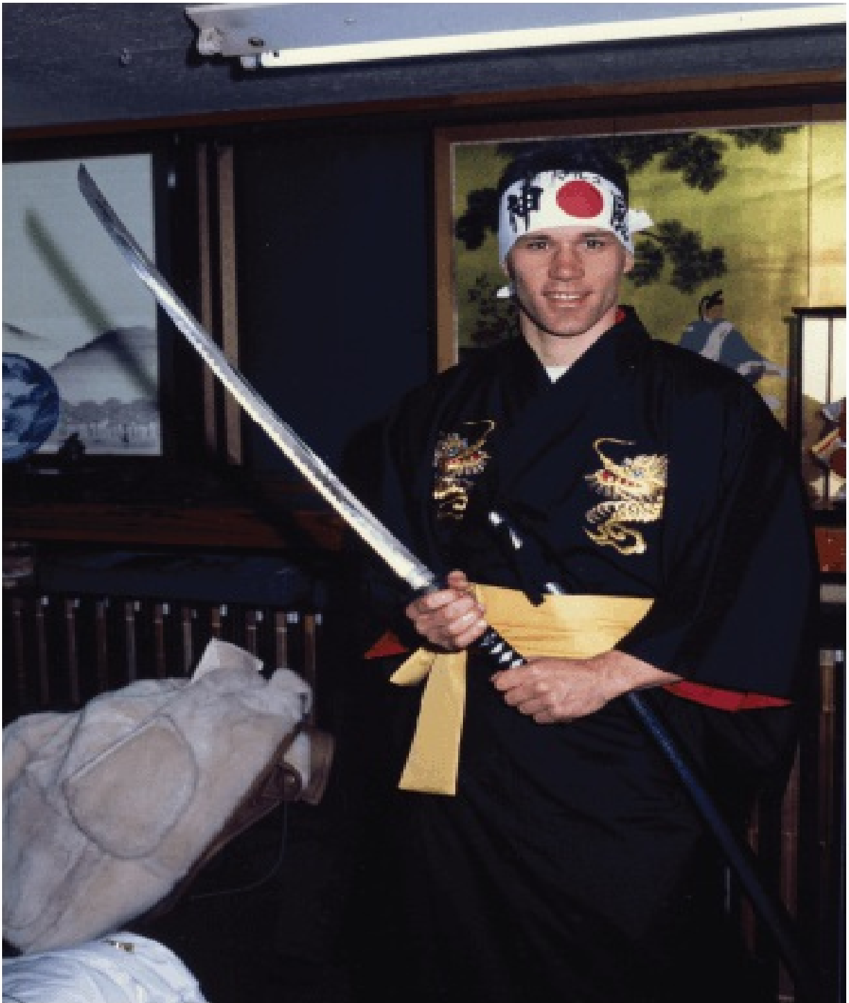
Марко по време на Световното първенство в Токио, 1989 г.