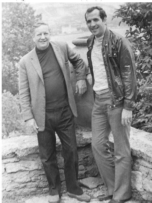
Ким Филби и автора през 1973 г.

За мен особено впечатляващо бе посещението ни в Граматиково, най-вече заради един епизод, за който и до днес нямам категорично обяснение и отговор.