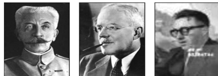
Маршал Лиоте Алън Дълес Агент Алис