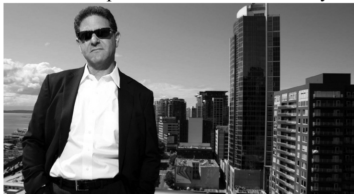
Ник Ханауер в Сиатъл

Съвсем наскоро един от младите американски милиардери, Ник Ханауер в статия отпрати предупреждение към американските си колеги богаташи: „Както я караме, скоро ще дойдат онези с вилите, за да ни изхвърлят на бунището“. Разбира се, той има предвид селскостопанския инструмент за събиране на сеното и на боклука!