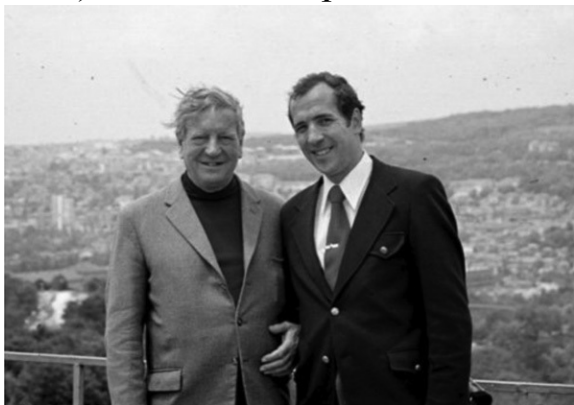
Ким Филби и авторът, някъде в Сакар

В първите години след Втората световна война се ражда идея за близка по цели и съдържание операция под кодовото название „Разцепващ фактор“ (Operation „Splinter Factor“). Нейн идеен родител е Алън Дълес.