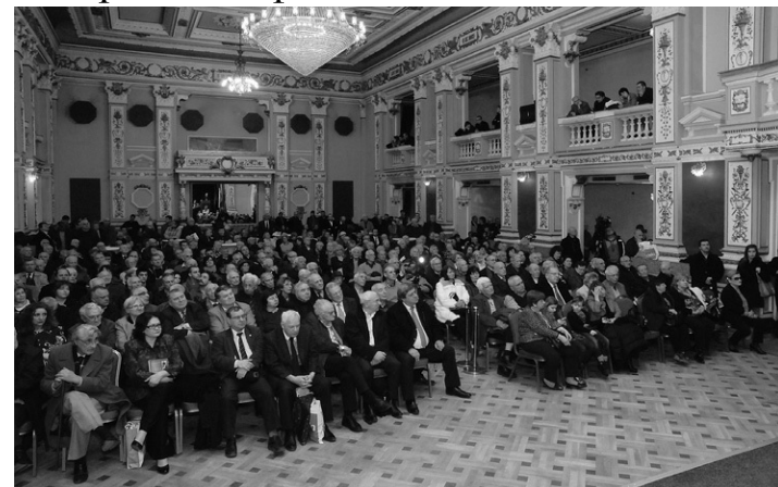
Премиера на книгата

Аз съм убеден, че това, което твърдя, някога ще бъде доказано и от все още скриваните исторически факти.