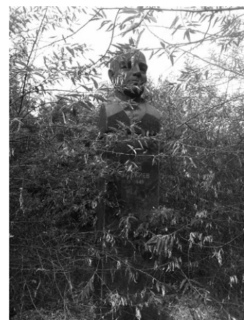
А в завода, кръстен на човека, който също през 30-те години е изградил и първата кооперативна корабостроителница във Василико, днес Царево, си личи как сега уважават паметта на българите, направили нещо за държавата си през своя кратък житейски път