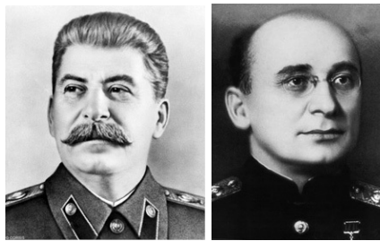
Йосиф Висарионович Сталин Лаврентий Павлович Берия