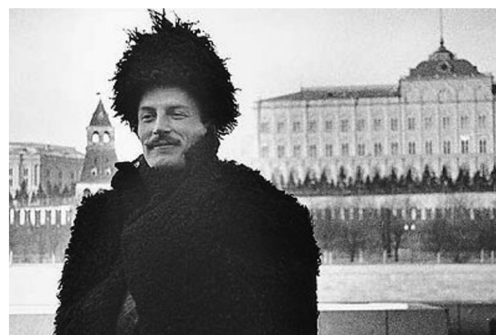
Фицрой Маклийн в Москва – 1938 г. „Ястребът на ястребите“ в руския отдел на Форин офис

В този късен февруарски ден на 1938 г., в последните лъчи на нетоплещото зимно слънце в центъра на Москва, в престижната сграда на британското посолство на „Смоленская набережная“ № 10, в един от централните офиси на втория етаж, пред голямото работно бюро, с лице към прозореца, загледан в подредените пред него листи, изпъстрени с дребния му калиграфски почерк, седеше вторият секретар по политическите въпроси Фицрой Маклийн.