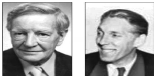
Ким Филби Ноел Филд