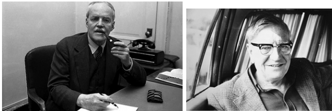
Алън Дълес и Ким Филби – старите приятели отново заедно, за да решат бъдещето на агент Алис.

Уолстрийт – офисът на „Съливан и Кромуел“.